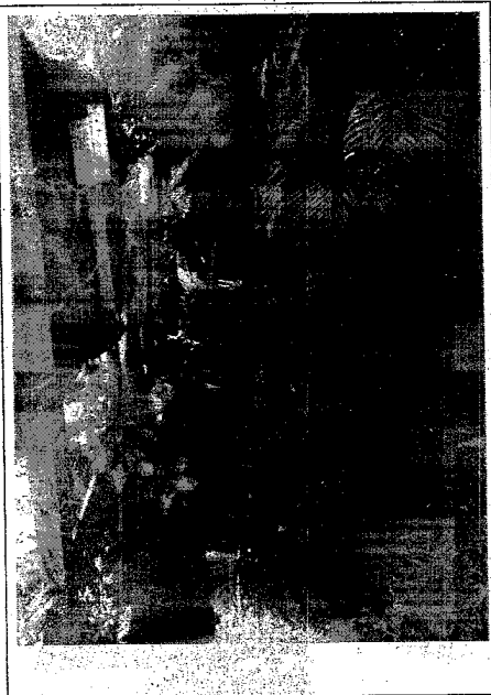
FOTO 07: canal a céu aberto, passagem entre caminho 1 e caminho 2 REFERÊNCIA: Vila Pedrita - Ilíngá

PREFEITURA MUNICIPAL DE LAURO DE FREITAS SECRETARIA MUNICIPAL DE INFRAESTRUTURA COORDENAÇÃO DE INFRAESTRUTURA