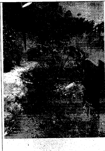
FOTO 08: canal a céu aberto, casas na beira do canal. REFERÊNCIA: Vila Pedrita - Ilíngá