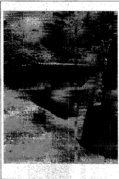
FOTO 05: trecho do canal coberto, área de grandes enchentes. REFERÊNCIA: Vila Pedrita - Itinga.

PREFEITURA MUNICIPAL DE LAURO DE FREITAS SECRETARIA MUNICIPAL DE INFRAESTRUTURA COORDENAÇÃO DE INFRAESTRUTURA