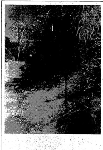
FOTO 01: encosta com risco de erosão. REFERÊNCIA: Vila Pedrita - Itinga

RUA: VILA PEDRITA - ITINGA DATA: 01/11/2023 CONTRATO: Novo Pac.