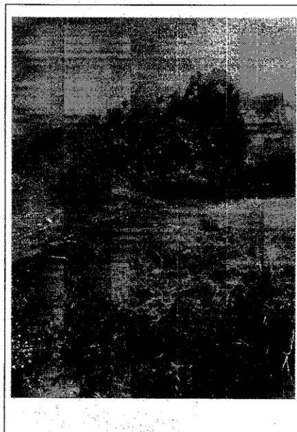
FOTO 02: área de desastre natural, desabamento de moradia em encosta REFERÊNCIA: Vila Pedrita - Itinga