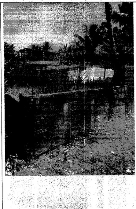
FOTO 07: casa abandonada devido a grandes enchentes que ocorreram em época de chuva. REFERÊNCIA: Vila Pedrita - Itinga

PREFEITURA MUNICIPAL DE LAURO DE FREITAS SECRETARIA MUNICIPAL DE INFRAESTRUTURA COORDENAÇÃO DE INFRAESTRUTURA